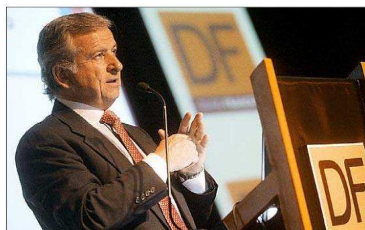
CRISIS.—Larraín reiteró que el Gobierno se encuentra afinando un plan de contingencia ante un eventual empeoramiento de la situación internacional.