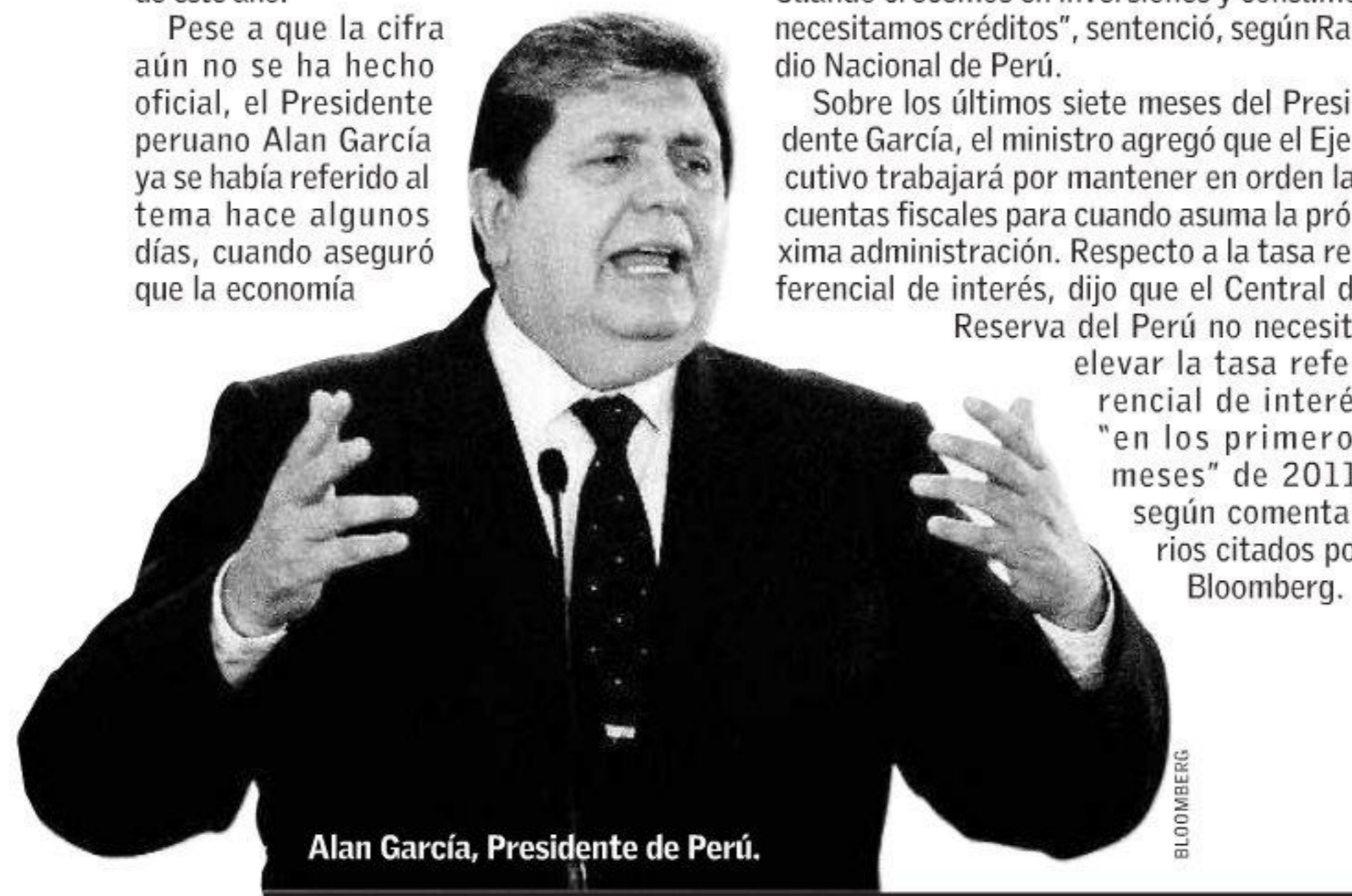
Alan García, Presidente de Perú.

Reserva del Perú no necesita elevar la tasa referencial de interés "en los primeros meses" de 2011, según comentarios citados por Bloomberg.