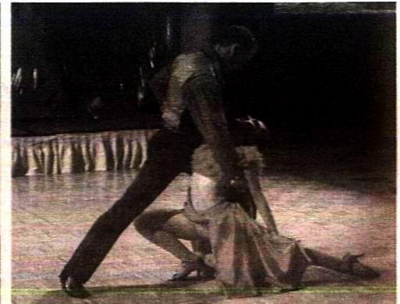
Ballroom, la magia del baile.